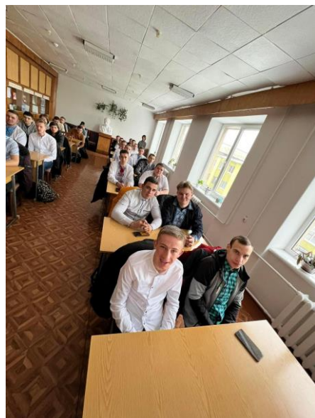
Грудень 2021 р.