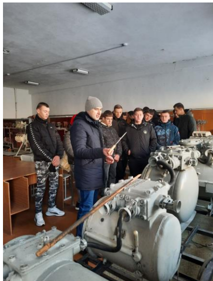
«Гірнича електротехніка» на тему: «Вивчення конструкцій і основних функцій, елементів схем магнітних пускачів ПМВІР-41».