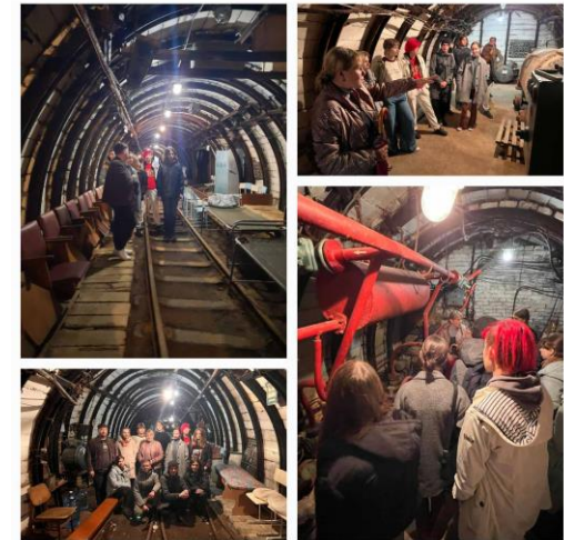
Учась членів комісії у профорієнтаційному квесті «BE in our КОЛЕДЖ»