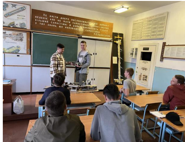
«Основи гірничого виробництва» проблемні лекції-екскурсія на шахти ДП «Львіввугілля»