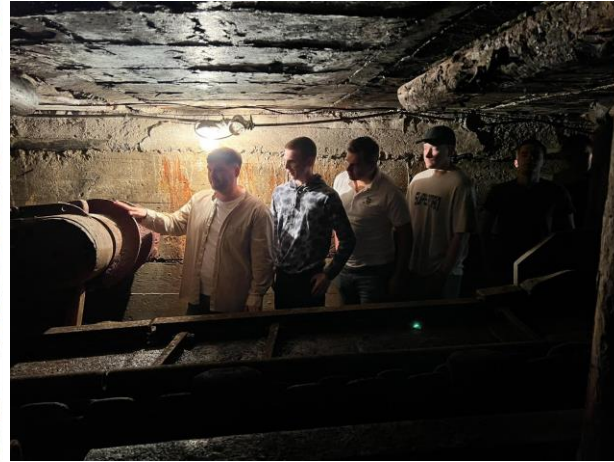
«Машини і комплекси» практичні заняття з вирішенням ситуаційних завдань