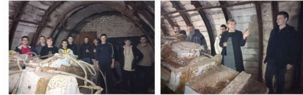
«Гірнича справа» інструктивні лекції з технології та механізації проведення виробок