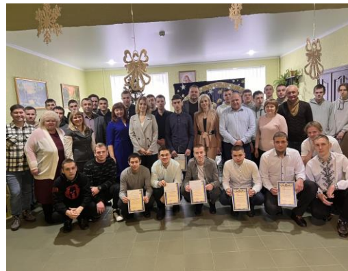
Грудень 2023 р.