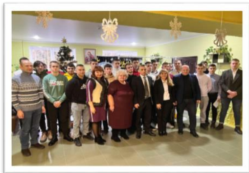
Грудень 2022 р.