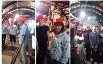
«Основи гірничого виробництва» проблемні лекції-екскурсії