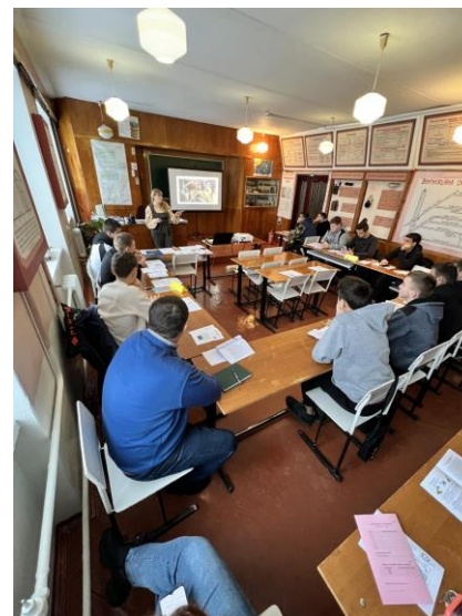
«Гірнича справа» з використанням інтерактивних вправ на тему: «Технологія та механізація проведення гірничих виробок».