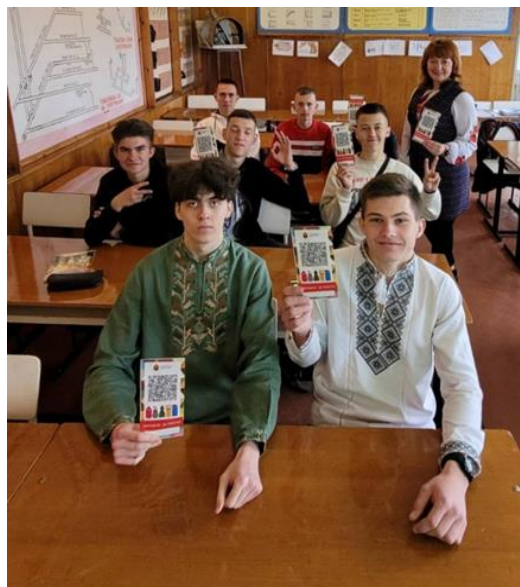
Бінарне заняття - екологічний тренінг